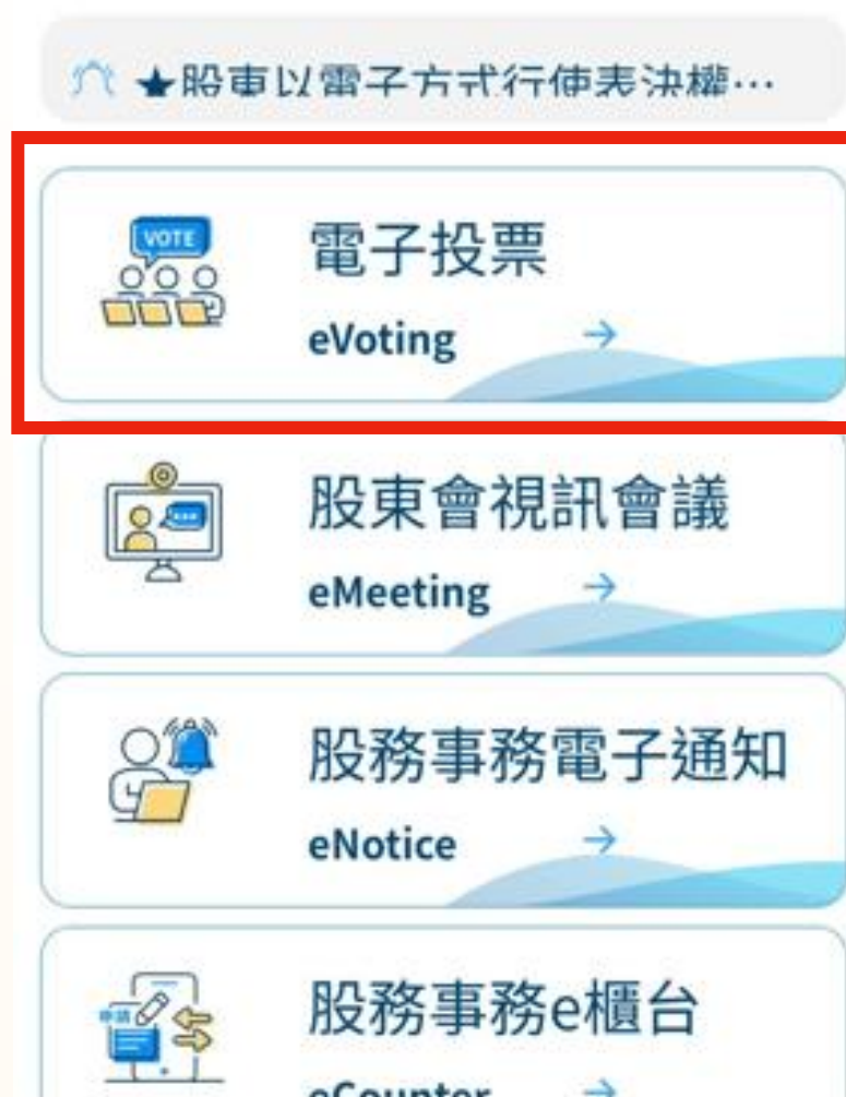
集保股東e服務 (電腦版)

資料來源：集保結算所、群益投信整理。實際時程可能視情況調整，如有變動將公告於群益投信理財網 ( www.capitalfund.com.tw )、公開資訊觀測站 ( mops.twse.com.tw )。ETF進行分割不影響投資人持有的基金資產總價值，須留意相關作業將暫停初級市場申購贖回、次級市場買賣與轉換，持有受益憑證之投資人於此期間無法進行任何交易。分割議案是否通過，須經持有代表已發行受益憑證之受益權單位總數 1/2 以上的受益人出席，並經出席受益人的表決權總數1/2以上同意。