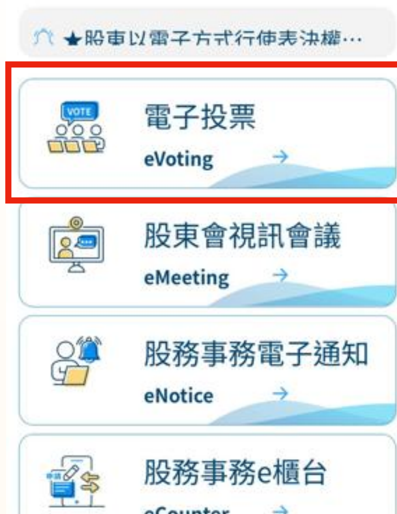
集保股東e服務 (電腦版)

資料來源：集保結算所、群益投信整理。實際時程可能視情況調整，如有變動將公告於群益投信理財網 ( www.capitalfund.com.tw )、公開資訊觀測站 ( mops.twse.com.tw )。ETF進行分割不影響投資人持有的基金資產總價值，須留意相關作業將暫停初級市場申購贖回、次級市場買賣與轉換，持有受益憑證之投資人於此期間無法進行任何交易。分割議案是否通過，須經持有代表已發行受益憑證之受益權單位總數 1/2 以上的受益人出席，並經出席受益人的表決權總數1/2以上同意。